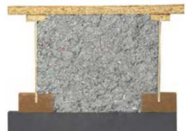
Sparrenexpander in Dämmplattenstreifen eingesteckt!

Lösung mit Sparrenexpander: Der genutete Dämmplattenstreifen (2,40 m Länge) wird auf dem Rohboden im erforderlichen Abstand (nach Vorgaben des Bodenplatten-Herstellers) ausgelegt. Für eine 18 mm starke Platte beträgt dieser üblicherweise zum Beispiel 62,5 cm. In die Nut wird (je nach erforderlicher Dämmstärke) der gewünschte Sparrenexpander hineingeschoben – fertig!