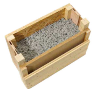
Objektbezogen fertigen wir die FT auch in Sondermaßen.